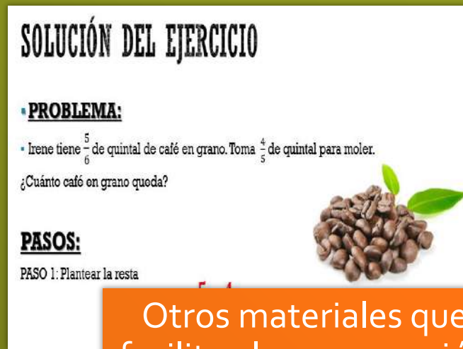
Otros materiales que faciliten la comprensión